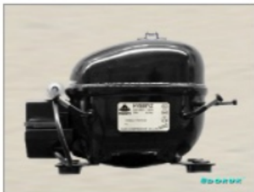
HY 81 Y