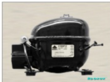
AE 1390 Y