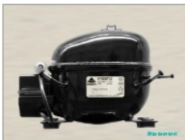
HYE 125 MSU