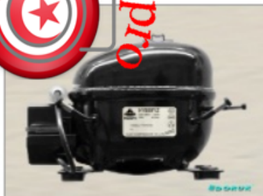
AE 1370 Y