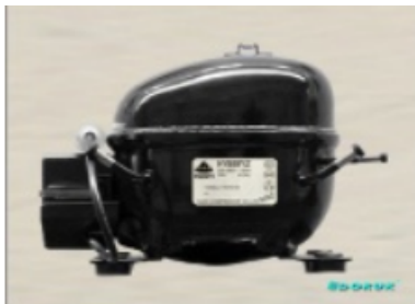
AE 1330 Y