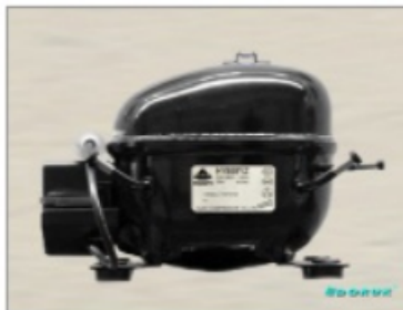
HYE 60 YL 63