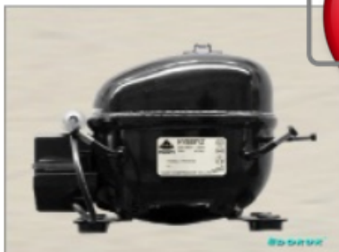
AE 1360 Y