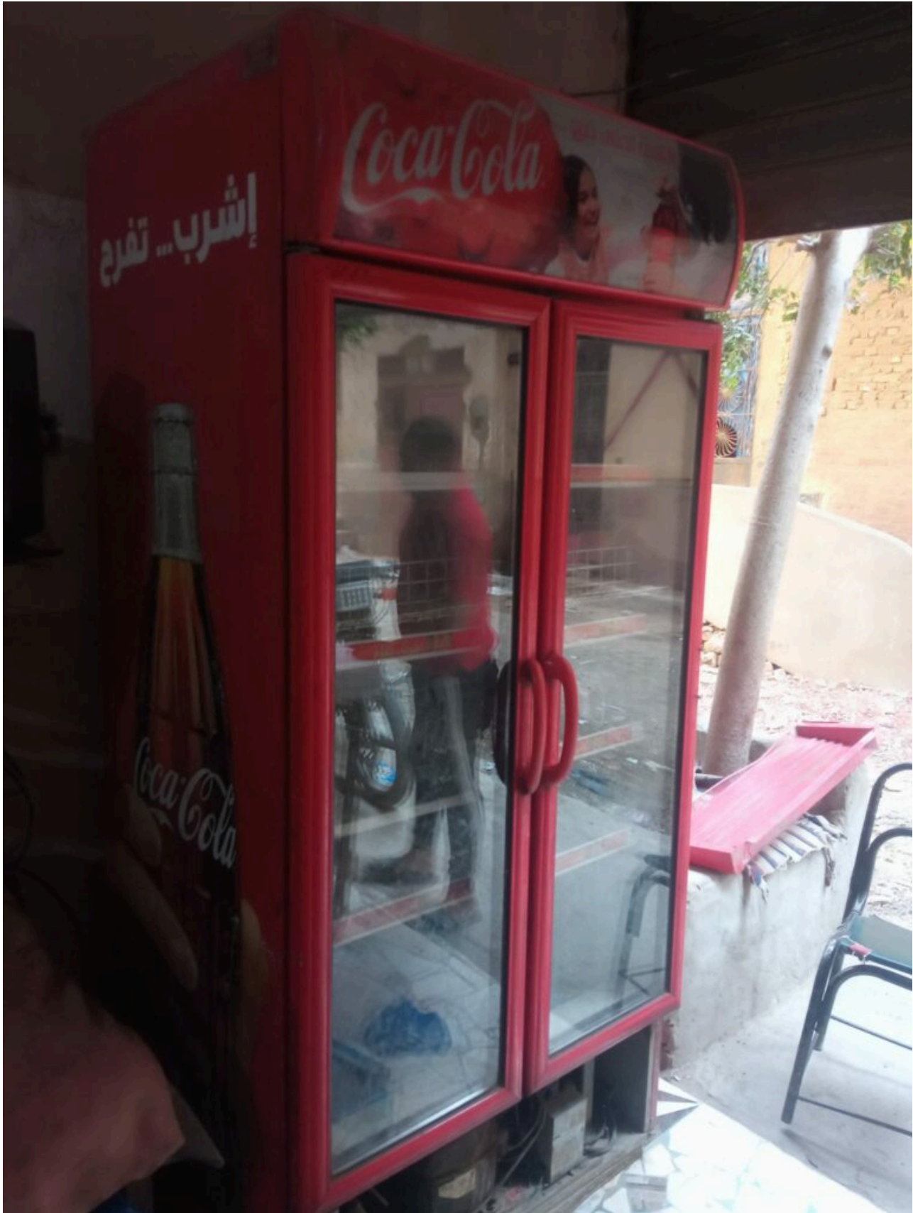
Mbsm.pro, CRC-1000SWL, CRC1000SWF02-C12-06790, COCA COLA, 2-DOOR, 1000L ,COMMERCIAL, GLASS, DISPLAY, FRIDGE, R-404a, 700 g, Compressor, SC15D, 1 hp, hbp