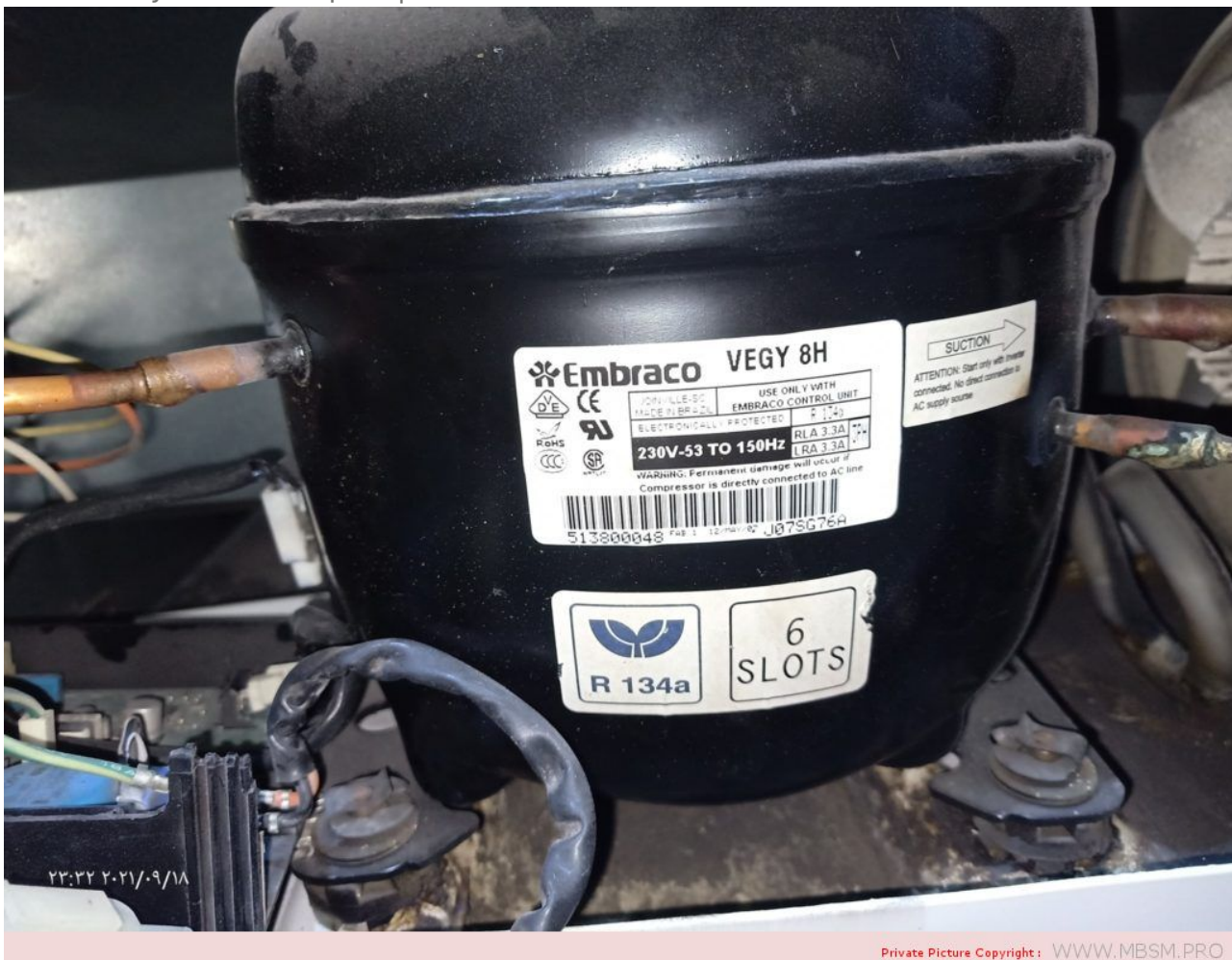
Embraco, VEGY 8H, Inverter Compressor, R134A, Refrigerator General Electric, 110, 1/4 HP, Variable Speed Compressor