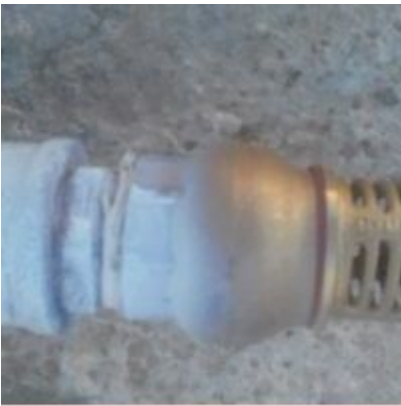
EJECTEUR-DAB-mbsm-dot-pro (6).jpg (318 KB)

Richard MBSM dot Pro www.mbsm.pro Picture Copyright: WWW.MBSM.PRO