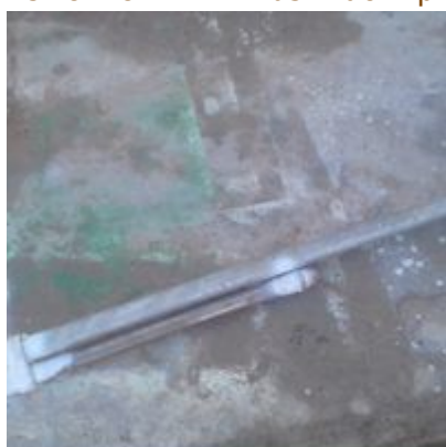
EJECTEUR-DAB-mbsm-dot-pro (2).jpg (465 KB)