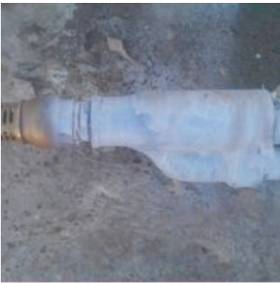
EJECTEUR-DAB-mbsm-dot-pro (3).jpg (467 KB)

Richard MBSM dot Pro www.mbsm.pro Photo Picture Copyright : WWW.MBSM.PRO