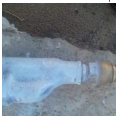
EJECTEUR-DAB-mbsm-dot-pro (7).jpg (451 KB)

Richard Mann-Gut Pro www.mbsm.pro Photo Picture Copyright: WWW.MBSM.PRO