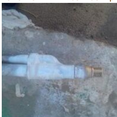
EJECTEUR-DAB-mbsm-dot-pro (5).jpg (524 KB)